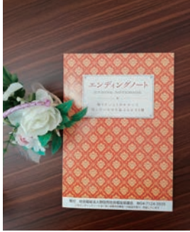
あなたの思いを書き留めておくために

（土・日・祝日・年末年始を除く） 配布する際に、簡単なアンケートに協力をお願いします