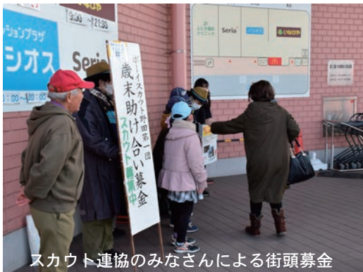
スカウト連協のみなさんによる街頭募金

主な内容>>②エンディングノート配布、会費報告、ファミサポ会員募集③斎場売店の案内、貸出案内、遊技場組合寄贈、おむつ配布 ④まちがいさがし、寄せられた善意、職員募集