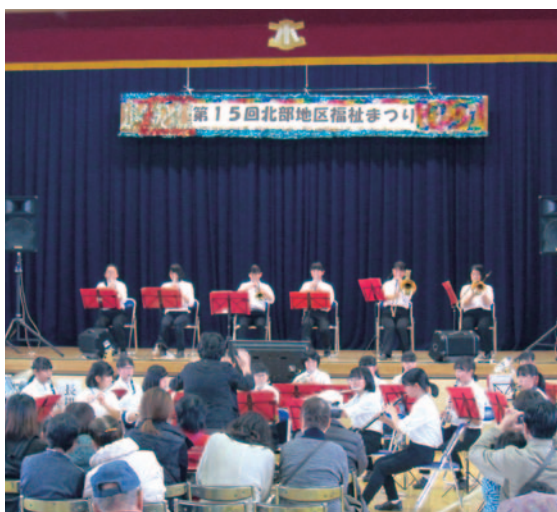
住民参加による福祉のまちづくりを推進 (地区社会福祉協議会活動)

社協では主に各種福祉サービスや相談活動、ボランティアの支援など、地域の特性に応じた活動を様々な場面で展開し、地域の福祉増進に取り組んでいます。