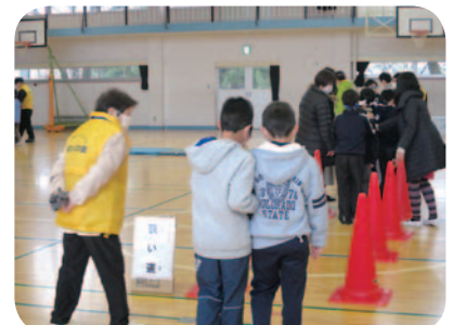
車椅子・目隠し歩行体験学習支援の様子