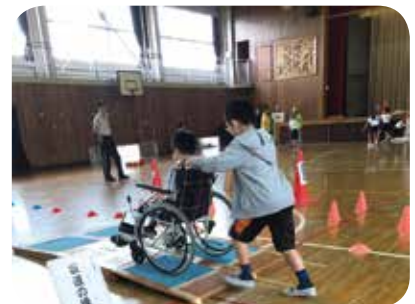
車いす・目かくし体験学習支援の様子