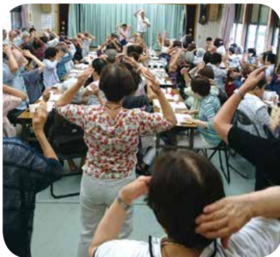
住民参加による福祉のまちづくりを推進 (地区社会福祉協議会活動)

社協では主に各種福祉サービスや相談活動、ボランティアの支援など、地域の特性に応じた活動を様々な場面で展開し、地域の福祉増進に取り組んでいます。