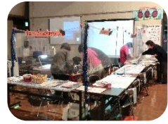
←中央公民館で活動の実演中！

参加団体からは「コロナ禍でお休みしていたから、久しぶりに活動できてよかった」との感想をいただくとともに、コロナ禍を経て新しく結成された団体もあり、それぞれに熱の入ったイベントになりました。