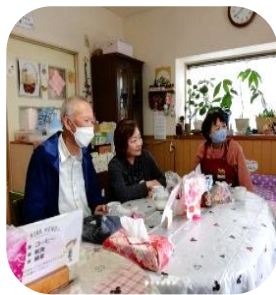
コーヒーでホットと一息