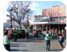
←みんなまで体操やスポーツ！「楽しかった」感想をいただきました

次回「じょいんと」は2月17日(土)を予定。この通信の表面でもボランティアを募集しています。ボランティアのみなさん、ご参加をお待ちしています！