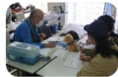
←おもちゃの修理受付中！

1月19日に「のだ市民活動ふれあいフェスティバル2023」を開催しました！昨年に引き続き、福祉や市民活動に関わるイベント「第22回市民ふれあいハートまつり」「福祉のまちづくりフェスティバル」「第6回市民活動元気アップふえすた」の3イベントが一堂に会しました。小春日和となった当日は、活動展示や実演・体験コーナーに加えて飲食ブースも増え、賑やかな一日でした。お越しいただいたみなさん、ありがとうございました。