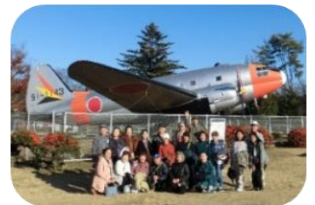
所沢航空記念公園のシンボルC-46輸送機と記念写真

12月8日にボランティアサロンを実施しました。約5年ぶりとなるサロンの行き先は、所沢航空記念公園内にある所沢航空発祥記念館です！銀杏色づく公園の散策も交えながら、記念館では所沢の空にまつわる映像の鑑賞や、展示品の見学をしました。参加したボランティアのみなさんは「初めまして」の方も「お久しぶり」の方も分け隔てなく、終始和やかな雰囲気の中で交流を深めていました。