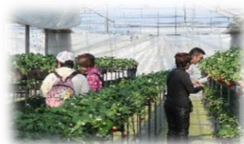
いちご狩りの様子