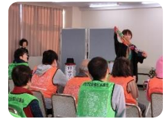
←マジックから 目が離せない！

次回「じょいんと」は2月15日を予定。この通信でもボランティアを募集しています。ボランティアのみなさん、ご参加をお待ちしています！