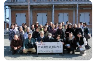
富岡製糸場での記念写真 良いお天気でした

参加したボランティアのみなさんは30名を超え、終始笑い声の絶えない交流会となりました。