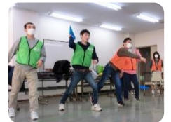
←遠くまで 飛ばそう！