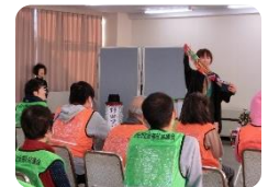
←マジックから 目が離せない！

次回「じょいんと」は2月15日を予定。この通信でもボランティアを募集しています。ボランティアのみなさん、ご参加をお待ちしています！