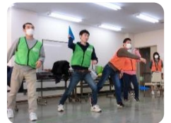
←遠くまで 飛ばそう！