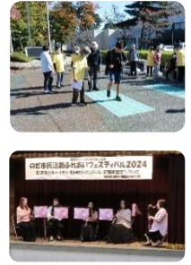
介護予防運動（写真上）と クラリネット演奏（写真下）

1月17日に「のだ市民活動ふれあいフェスティバル 2024」を開催しました！ 昨年に引き続き、福祉や市民活動に関わるイベント「第23回市民ふれあいハートまつり」「福祉のまちづくりフェスティバル」「第7回市民活動元気アップふえすた」の3イベントが同時開催されました。当日は好天に恵まれ、活動展示や実演・体験コーナー、飲食ブースで大いに賑わいました。お越しいただいたみなさん、ありがとうございました。