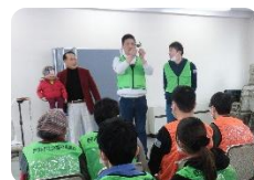
←腹話術と 即席コラボ！?

次回「じょいんと」は2月21日を予定。この通信でもボランティアを募集しています。ボランティアのみなさん、ご参加をお待ちしています！