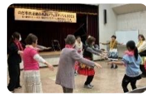
体験工作中！（右） 観客と一緒にフラダンス（左）

1月23日に「のだ市民活動ふれあいフェスティバル 2025」を開催しました！ 昨年に引き続き、福祉や市民活動に関わるイベント「第24回市民ふれあいハートまつり」「福祉のまちづくりフェスティバル」「第8回市民活動元気アップふえすた」の3イベントを同時開催。当日は活動展示や実演・体験コーナー、飲食ブースが数多く出店し、大いににぎわいました。