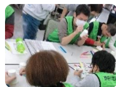
←オリジナルの 紙コップ製作中