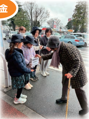
スカウト連協のみなさんによる街頭募金

厳しい経済状況の中、歳末たすけあい募金の総額は、281万8千324円となりました。(令和8年1月末日現在) あらためて、お礼申し上げます。 お寄せいただいた募金は、準要保護世帯などの支援を必要とする方々(150世帯・407人)に「歳末見舞」として、街の活性化にもつながるよう市内共通商品券(NOX)を配布した他、70歳以上のひ