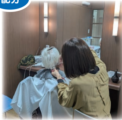
心も身体もリフレッシュ!

とり暮らしで要介護1以上の方へエアコン・クリーニングサービスを合計10世帯に行いました。