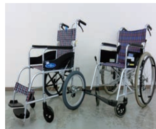
貸出状況はお問合せを