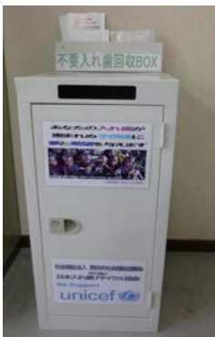
リサイクルで社会貢献も