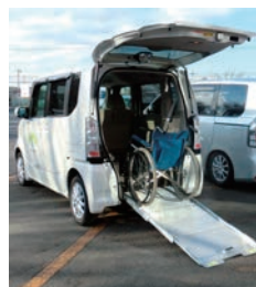
運転手は利用される方で確保をお願いします

社会福祉協議会では、不要になった入れ歯を回収しています。入れ歯や虫歯治療で削った歯の上部にかぶせる「クラウン」などには、金、銀、パラジウムといったレアメタル(希少金属)が使われており、これをリサイクルする活動です。長く使ったものでも、価値ある資源として利用できます。