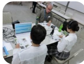
(写真上) マイクで録音中！ (写真右) 興風会館前にて

8月21日には、むらさきの里野田ガイドの会の皆さんと「野田市ガイドボランティア体験」を実施しました。参加者の皆さんは、伝統的な和風建築に近代風の設備が取り入れられた野田市市民会館と、建築から96年を迎える興風会館をそれぞれ見学。また、実際の活動しながら名所の案内にチャレンジするなど、野田市の魅力をより深く知る機会になりました。